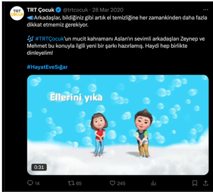
Görsel 3. Sağlık Bakanlığı ve TRT Çocuk Hayat Eve Sığar Uygulaması İş Birliği.

Bu bağlamda, dijital sağlık uygulamalarının etkinliği yalnızca teknolojik altyapıyla değil, aynı zamanda sosyal adalet, şeffaflık ve güven unsurlarının sağlanmasıyla doğrudan ilişkilidir. Uygulamalardaki erişim ve mahremiyet sorunlarının giderilmesi, büyük veri tabanlı sağlık politikalarının toplumsal kabulü ve sürdürülebilirliği açısından kritik öneme sahiptir.