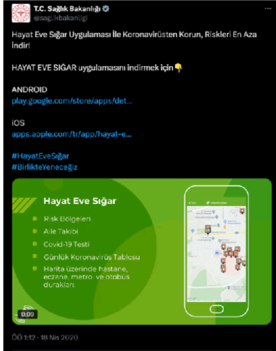
Görsel 2. X Platformunda "HES" Uygulaması ile İlgili Bilgilendirme.

Şekil 1’de HES uygulamasının arayüzü bulunmaktadır. HES uygulamasının sunduğu önemli avantajlardan biri, gerçek zamanlı izleme ve analiz yetenekleri aracılığıyla salgının yayılım hızına karşı hızlı tepki geliştirilmesine imkân sağlamaktadır. Tanı konulan bireylerden temaslarının tespiti, yüksek risk barındıran alanların dijital haritalandırılması ve toplumsal bulaş eğilimlerinin öngörülmesi, bu uygulamanın katkı sunduğu alanlar arasında yer almaktadır. Şekil 2’de görüldüğü üzere T.C. Sağlık Bakanlığı tarafından HES uygulaması ile ilgili bilgilendirici tweetler atılmaktadır. Böylelikle bireyler, kendi risk seviyelerine ilişkin bilgilere ulaşarak kişisel önlemlerini artırabilmekte, kamu otoriteleri ise veri temelli politikalar geliştirerek kaynakları daha etkin yönetebilmektedir. Toplu ulaşım, kamu kurumları ve sosyal mekânlara girişte HES kodu kontrolleri uygulanarak potansiyel risk taşıyan bireylerin toplumla temasının sınırlandırılması hedeflenmektedir.